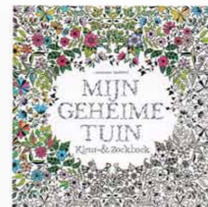
De eersteling van THOTH