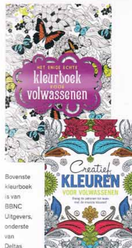
Bovenste kleurboek is van BBNC Uitgevers, onderste van Deltas